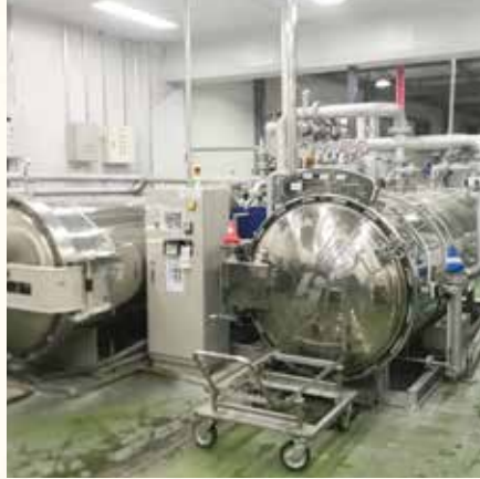
Retort Sterilizer 레토르트기기