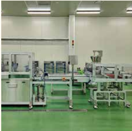
Burrito Wrapping Machine 부리또 성형기