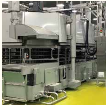
Tube packaging line 튜브 포장 라인