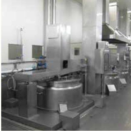
Liquid mixer 소스 배합 탱크