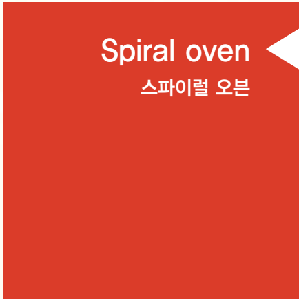
Spiral oven 스파이럴 오븐