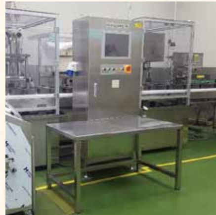
Marinated meat packaging machine 양념육 포장기